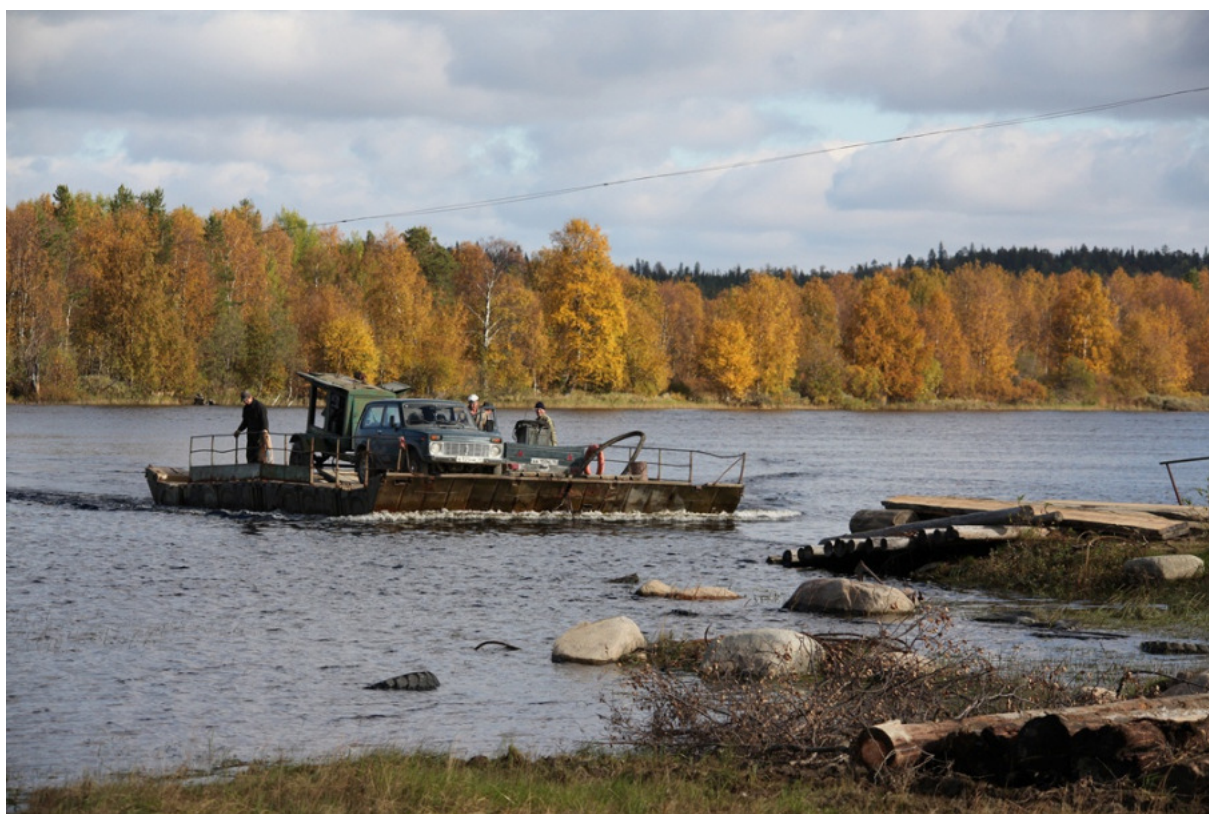
Lautta yli Kemijoen. Huteran näköinen dieselmotorilla vedettävä härveli osoittautui toimivaksi.