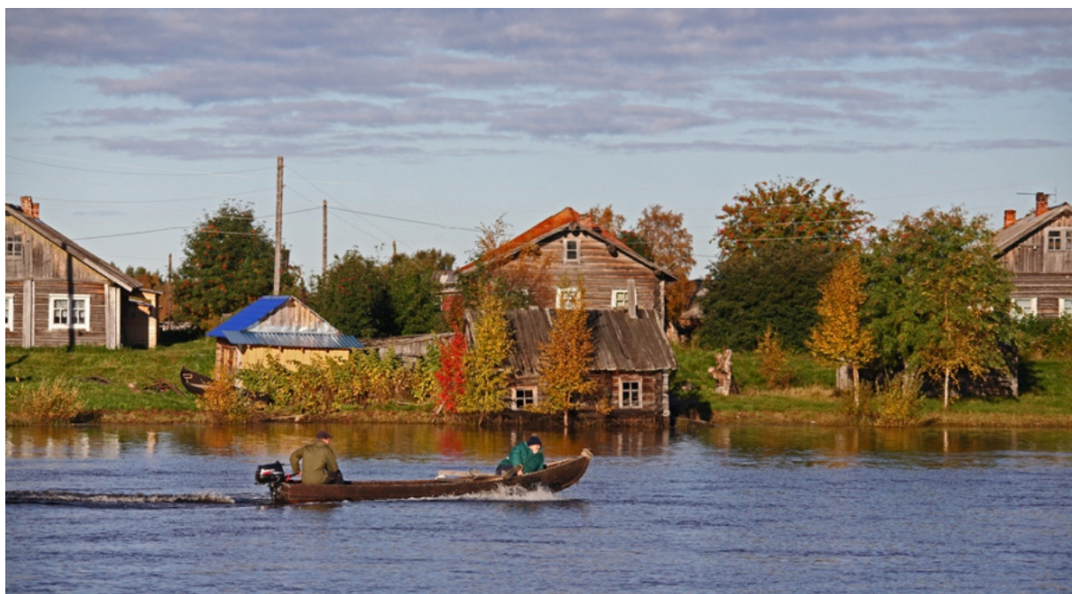
Jyskyjärvellä eletään paljolti omavaraistaloudessa. Kalastajat astuvat veneisiinsä jo aamulla.

On mielenkiintoista havaita, että näinkin kaukana Suomen rajasta puhutaan suomea, vaikka nämä alueet eivät ole lähelläkään luovutettua Karjalaa eivätkä ole koskaan kuuluneet Suomeen. Itse asiassa koko Karjalan käsite on laajempi kuin usein tunnutaan ajattelevan: arkikeskusteluissa puhutaan yleensä Karjalasta tarkoittaen vain toisessa maailmansodassa