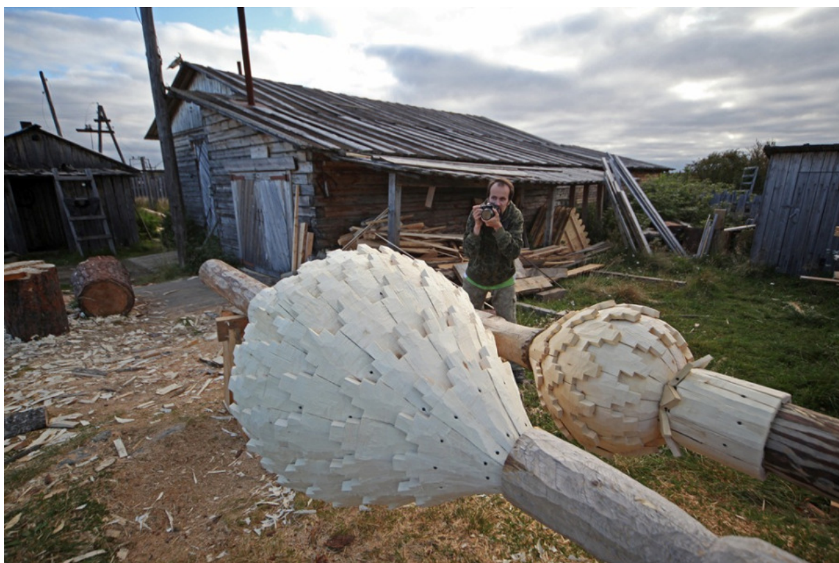
Paanajärven kylän perinteet ovat säilyneet elinvoimaisina. Myös suomalaisia käy siellä talkoissa.

Takapajuisuus on toisaalta myös etu, ainakin luonnon näkökulmasta: koko Vienan Karjala on kuin yhtä suurta kansallispuistoa. Ojittamattomat suot ja kirveenkoskemattomat aarniometsät näyttävät jatkuvan silmänkanta-