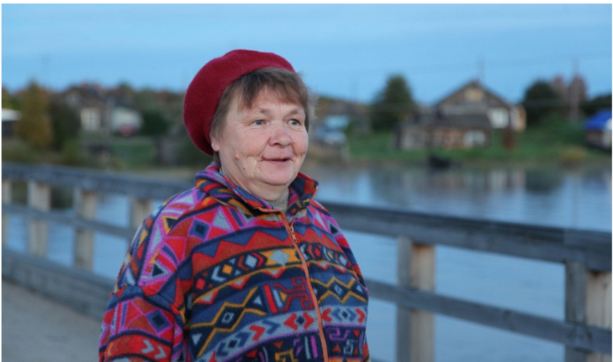
Karjalaisnainen käveli vastaan Jyskyjärvellä ja alkoi solkata suomea, vaikka raja on kaukana..

Neuvostoliitolle menetettyjä alueita. Karjala ei ole myöskään vain se alue, joka nykyisin kuuluu Venäjän federaation osaan nimeltä Karjalan tasavalta, vaikka se kattaakin suurimman osan Karjalasta.