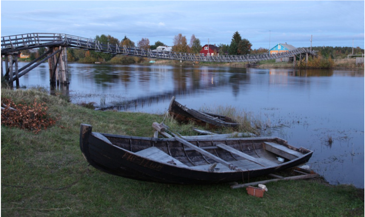
Jyskyjärvi on Vienan alueen parhaiten säilyneitä karjalaiskyliä. Se sijaitsee keskellä ei-mitään.