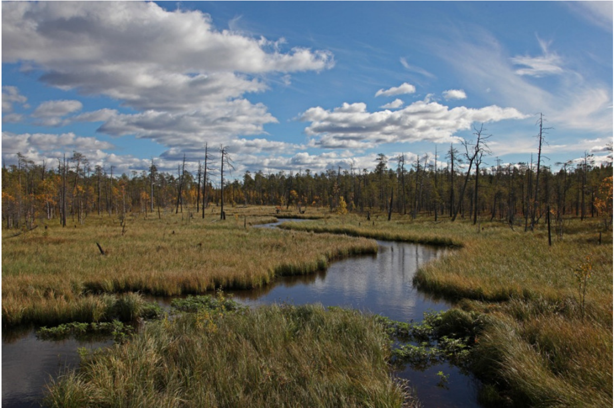
Vienan Karjalan kaunista erämaata. Koko alue on kuin yhtä suurta kansallispuistoa.