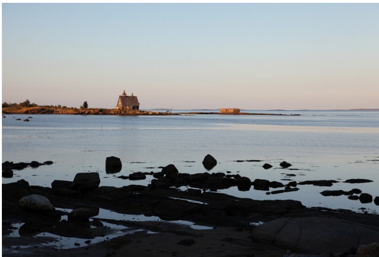
Kuin olisi maailman laidalla: Vienanmeren ulappaa aukeaa Kemijoen suulta kohti itää.