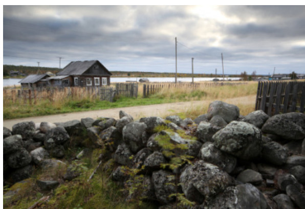
Paanajärven karjalaiskylän raitti.

Paanajärven kylän kohdalla Kemijoki on todella leveä, toistasataa metriä. Emme ole uskoa silmiämme, kun näemme lautan: se on ainakin sadan vuoden takaista tekniikkaa, ja hirvittää ajaa iso matkailuauto kiikkerän näköisen puu- ja metallivirityksen päälle. Mutta nyt ollaankin Venäjällä, jossa karski äijäkulttuuri on kunniaissaan, eikä täällä ole tapana