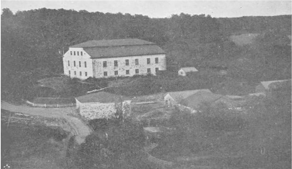
Kuva 3. Siuntion Sjundbyn kartanon linnamaisen päärakennuksen työt aloitettiin 1560-luvulla [9].

rajan pohjoispuolisilla melko uusilla asutusalueilla talonpojat olivat tottuneet omatoimisuuteen, olivat aseistautuneita ja saivat siksi helposti liikkeelle suuren määrän miehiä. Heillä tuskin oli käsitystä suurista kuvioista, mutta he reagoivat paikallisesti kasvaneeseen verorasitukseen. Nuijasotaan liittyvät tapahtumat saivat uudisasukkaita siirtymään uusiin maisemiin. Haasteenani onkin seuraavassa vaiheessa katsoa, olivatko Rahkosten lisäksi vuonna 1598 Ullavaan asettuneet viisi perhettä lähtöisin näiltä samoilta seuduilta. Tapahtumilla on siten selvä vaikutus vielä nykypäiväänkin, sillä suuri joukko Keski-Pohjanmaan asukkaista kantaa tuolloin muutaneiden Rahkosten geneejiä.