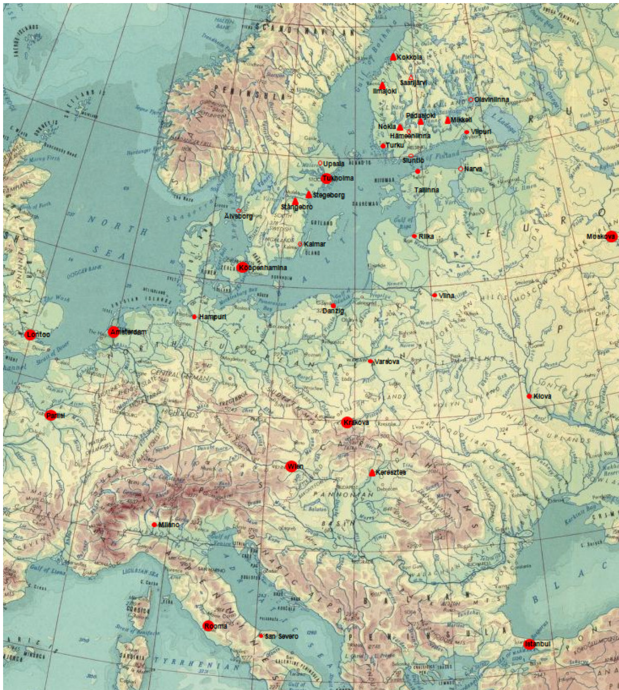
Kuva 2. Missio Sueticaan liittyviä Euroopan hallituspaikkoja 1500-luvun lopulla (isot ympyrät), kaupunkeja (pienet ympyrät), muita tapahtumapaikkoja (avoimet pienet ympyrät) sekä taistelupaikkoja (kolmiot).

kansa sekä myös henkilöllisyytensä selviää. Näyttää siltä, että uhrin olivat satunnaisesti paikalla tavattuja eikä varsinaisia ratsumiesten tuhoamisoperaation suunnittelijoita, jotka olivat vihjeen saatuaan siirtyneet turvallisimmille paikoille. Kuvan 1 kartasta selviää, että Kivijärvi sijaitsi juuri sillä alueella, josta perimätiedon mukaan Ullavan Rahkosen asukkaat tulivat [15]. Asiakirjatieto saman vuoden