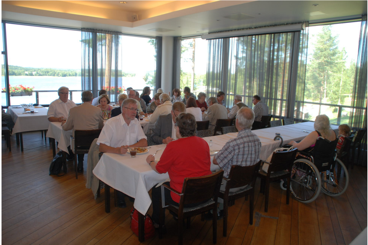
Suvun tapaaminen alkoi Peurungassa yhteisellä lounaalla. Näissä maisemissa Keski-Suomi näytti parhaita puoliaan.